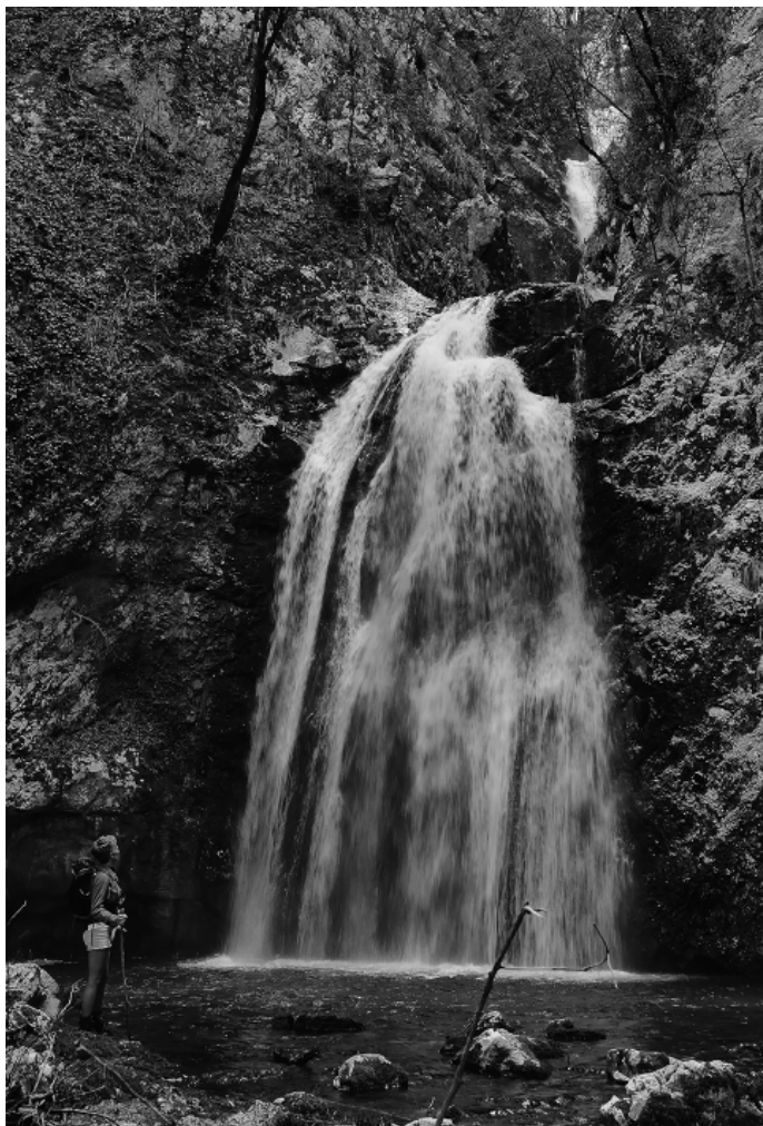
Cascata della Tufara

Il programma delle attività riportate in questo volume è consultabile sul sito