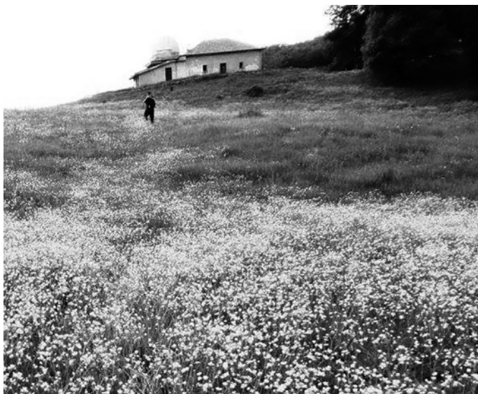
Rifugio Aresta - Monti Alburni