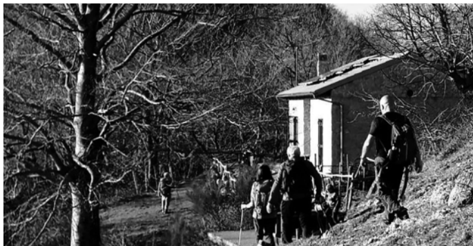
Rifugio delle Miniere - Monti Picentini