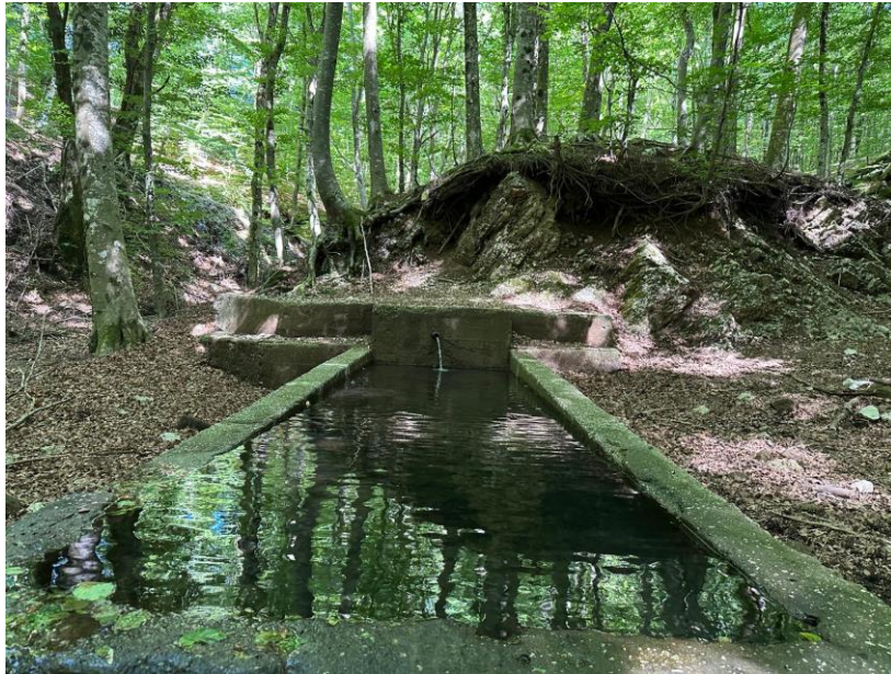
Figura 4 Acqua della Tufarola