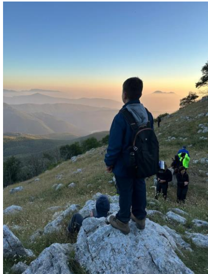
Figura 3 panorami Roccaglie