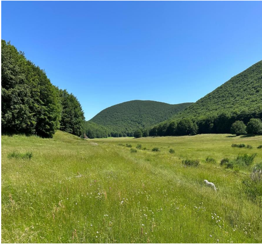
Figura 1 Campo Maggiore