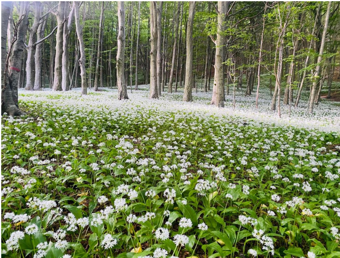
Figura 5 Aglio Orsino in fioritura